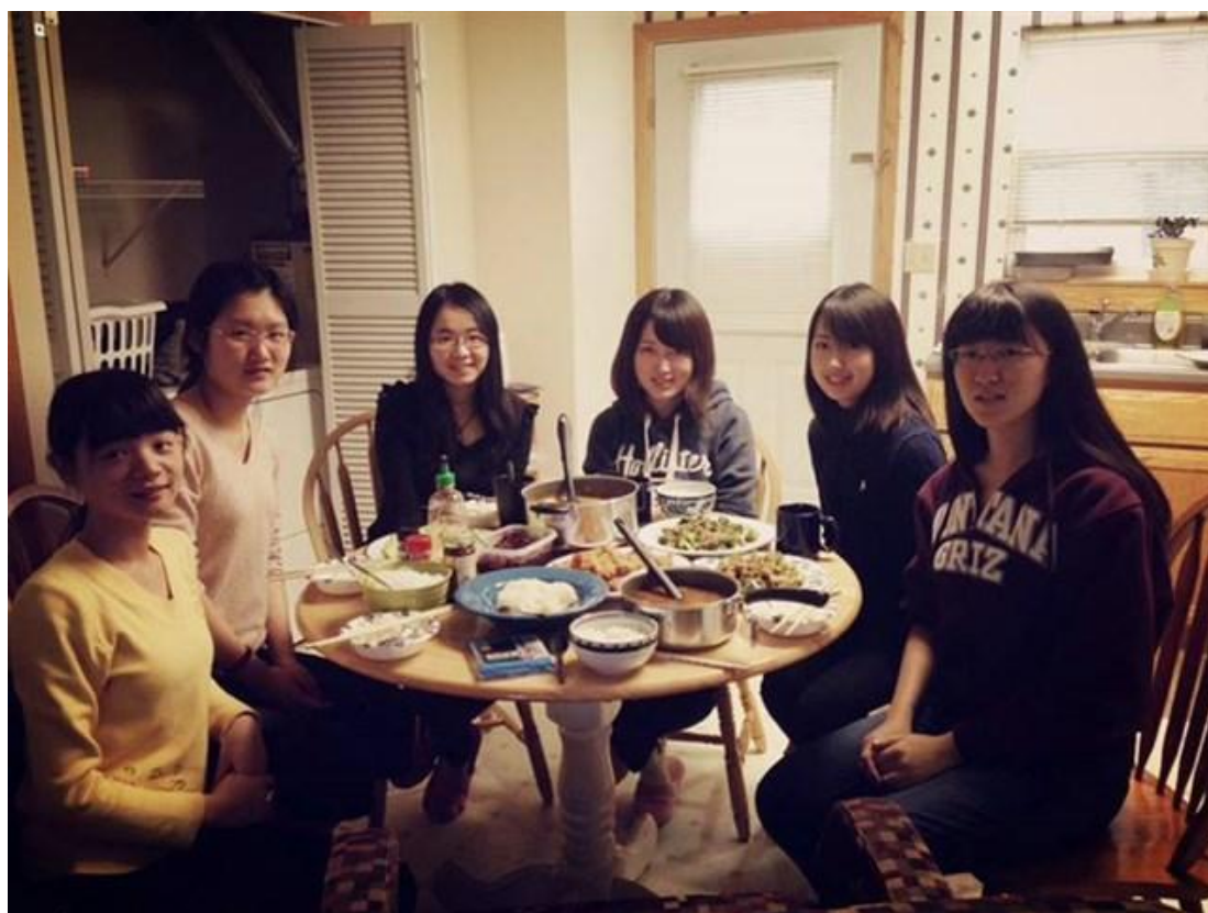
在公寓里请其他国际学生吃饭