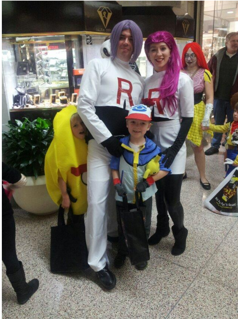
商场里面穿着万圣节服装的人们