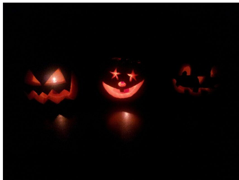
我和我刻的南瓜灯

这趟赴美交换让我提高了语言水平，开拓了国际视野同时，还锻炼了独立生活的能力。从前的我在父母跟前饭来张口衣来伸手，这么多年都不会自己做饭。出国这一趟因为是在校外租公寓只能自己做饭，所以逼着自己学会了如何在外独立生活。除此之外还结识了友好家庭，近距离接触美国家庭并了解他们的生活习惯和节日风俗，比如圣诞节一起刻南瓜灯，看家长领着小朋友身着特色奇特的服装讨糖果等。也曾结识一些国际友人，和她们亲切地交谈、一起去郊游或者请她们品尝我们亲手烹饪的菜肴。