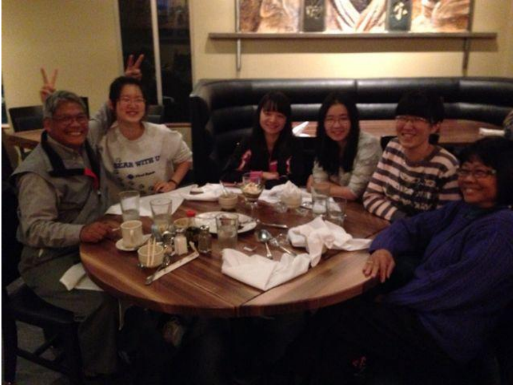
我们和越南夫妇共进晚餐