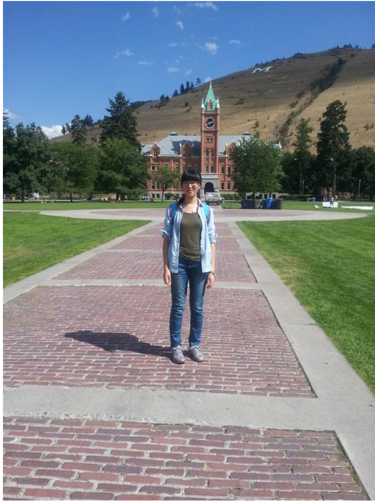
我与 M 山

开学初相当的忙碌，完全适应上课和考试大概用了将近一个月。因为美国的教学模式和中国大学有所不同，中国的高校学习以自学和自主学习为主，很多专业课后不需要花太多时间。而美国的大学学习模式是课上一小时课后三小时，在上课之前需要花大量时间来预习和完成老师的指定阅读材料，并且有大量的课堂讨论以及 3-4 次期中考试，学习强度类似于我们的高中。我其实前半学期都不大能适应这种课后学习的模式，大量的阅读对我的英语水平是挺大的挑战，复杂专业知识和术语更是对我尤为困难，所以刚开始我很多时候不能完成老师指定的阅读材料。所幸开学初的几次考试内容比较简单，所以成绩相对理想。不过期中考试阶段又遇到了困难，因为试题难度加大，而我的英语水平还没有足够的提高，密集到几乎每天都有至少一门考试的强度让我很吃不消。学期的后半段随着英语水平逐渐提高和对课程的适应，无论是对课程内容的理解还是考试成绩都达到了