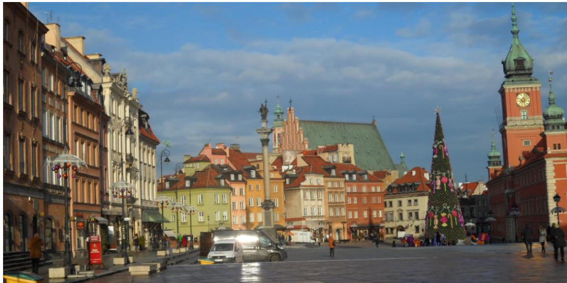
(图：阳光下五彩缤纷的华沙)

我旅行的首要原则就是远离旅游团，这样子旅游比较自由——如果愿意，就完全可以在广场的台阶上晒着太阳坐到黄昏。此外，自由行中经常会遇到一些有趣的人或事，这也是旅行的一大乐趣。