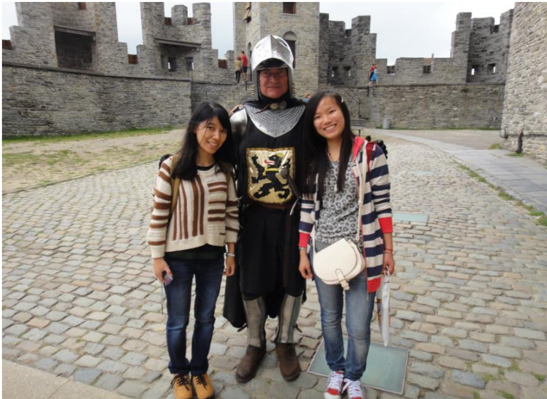
(与布鲁塞尔城堡的守卫合影留念)