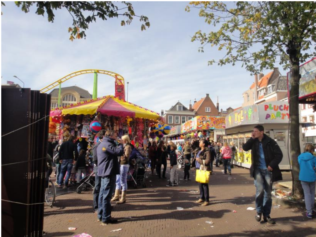
（图：莱顿城一夜间化身为游乐场）

学期结束以后，我们背起行囊，游览了欧洲不少国家。长长的旅途结束，再一次回到莱顿，风尘仆仆的我深夜里又一次踏上了小城的红色砖石铺就的小路。此时深切地体会到这座小城很容易给人一种家的感觉，静静的美丽中透出一种安全感。而荷兰人这个金发的民族，没有德国人的严肃和法国人的傲慢，总给人一种天生乐天派的感觉。即便是在阴雨连连的天气里，路上人们的笑容也永远那么灿烂。