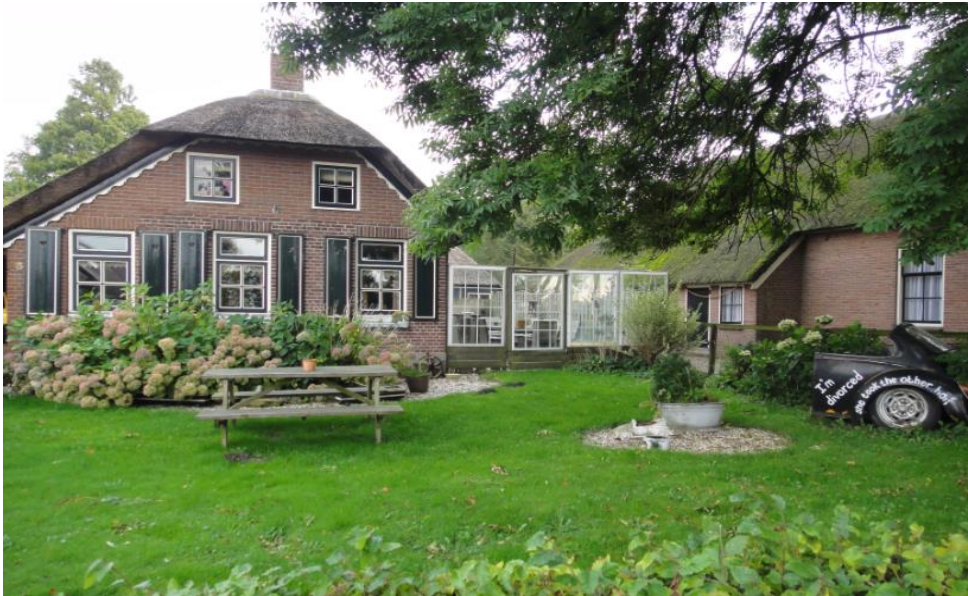
（荷兰的羊角村，小桥流水和漂亮的房子，是到荷兰的必游之地）