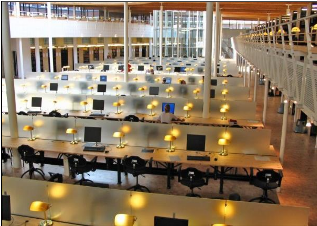
(图：莱顿大学法学院图书馆)

2013年9月，我有幸参加了上外法学院与荷兰莱顿大学法学院的合作交流项目，就此开始了这段为期半年的珍贵旅程。如今我已回到上外熟悉的校园，而莱顿这座一尘不染的安静的欧洲小镇，城内交错的运河和周末河里划船休闲的人们，甚至于那淫雨霏霏的天气和运河旁水鸟的怪叫声，都依然如此清晰。二十年以来，我第一次离开国土。从激动忐忑的期待到异国他乡的探索到美丽多彩的回忆，交流的半年定会是我人生中最值得回味的半年之一。现在简单地记录一下这段时间的经历和感受、经验和教训，是给自己的一个总结，也供学弟学妹们参考。