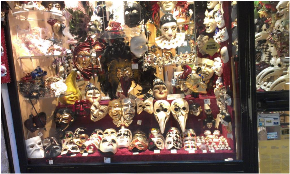
(威尼斯街边商铺琳琅满目的面具)